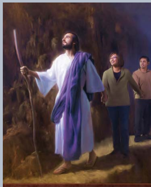
El pueblo de Dios ha elegido seguirlo a pesar de lo que el hombre pueda tratar de hacerle.