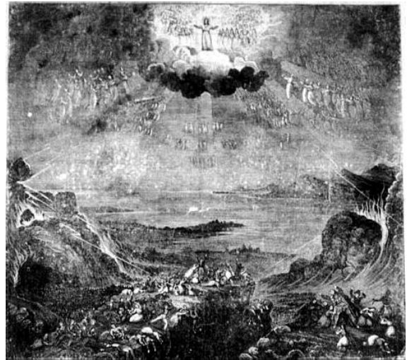
Los Impíos huyendo de Cristo.

“Terriblemente se habrá de cumplir esta oración en el gran día del juicio. Cuando Cristo vuelva a la tierra, los hombres no le verán como preso rodeado por una turba. Le verán como Rey del cielo. Cristo volverá en su gloria, en la gloria de su Padre y en la gloria de los santos ángeles. Miradas y miradas, y miles de miles de ángeles, hermosos y triunfantes hijos de Dios que poseen una belleza y gloria superiores a todo lo que conocemos, le escoltarán en su regreso. Entonces se sentará sobre el trono de su gloria y delante de él se congregarán todas las naciones.” El Deseado de Todas las Gentes, 688-689.