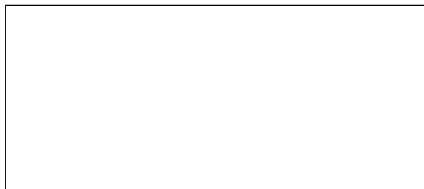
El General Berthier lleva cautivo al Papa.