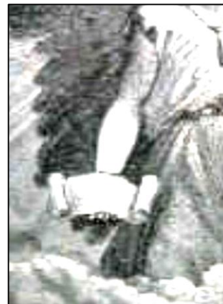
El pequeño libro abierto en la mano del Ángel era el libro de Daniel que había sido sellado

“Además, vemos que en ambos lugares el contenido atribuido al libro es el mismo. El libro que a Daniel se le pidió cerrar y sellar se refería a tiempo: ‘ ¿Cuándo se cumplirán estas maravillas? ’ Daniel 12:6 . Cuando el ángel de este capítulo descende con el libro abierto, sobre el cual él basa su proclamación, él emite un mensaje en relación a tiempo , como se verá en el versículo 6. Nada más se requiere para mostrar que ambas expresiones se refieren a un solo libro; y tampoco para demostrar que el pequeño libro, que el ángel tenía en su mano, y abierto, era el libro mencionado en la profecía de Daniel.” Smith, DR, 519-520 .