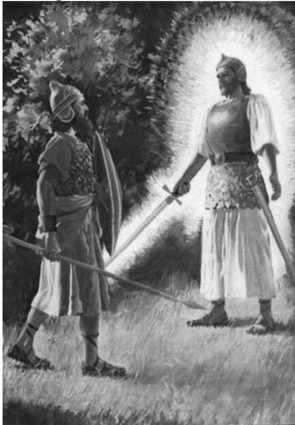
Jesús, el Capitán de la Huestes del Señor, con Josué

“ ‘Un día, cuando Josué estaba cerca de Jericó, alzó sus ojos y vio a un hombre ante él con una espada desenvainada en la mano. Y yendo hacia él, le preguntó: ‘¿Eres de los nuestros, o de nuestros enemigos?’ Y él respondió: ‘No. Yo Soy el Príncipe del ejército del Eterno, que he venido.’ Entonces Josué se prostró en tierra, lo adoró y le dijo: ‘Qué manda mi señor a su siervo?’ Y el Príncipe del ejército del Eterno respondió a Josué: ‘Quita el calzado de tus pies, porque el lugar donde estás es santo.’ Y Josué lo hizo así.” Josué 5:13-15.