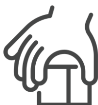
Habilidades motoras gruesas