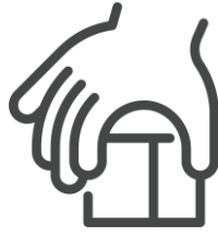
Habilidades motoras gruesas