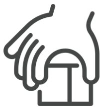
Habilidades motoras gruesas