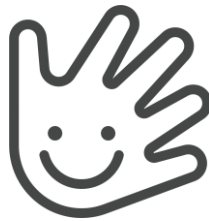
Habilidades motoras finas