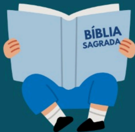
Estudio de la Biblia (1 Tm 4:13)