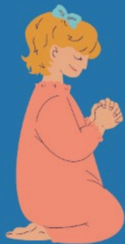
Oraci n (1 Ts 5:17)

Habr  un tiempo de angustia cual nunca hubo (Mt 24:21; Mr 13:19). El cristiano le teme, pero debe prepararse para ese d a por medio de la: