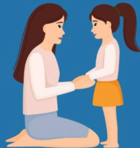
Testimonio personal (1 Ct 9:16-23)

Solo desarrollando y fortaleciendo una relaci n con Dios a trav s de la b squeda del Esp ritu Santo, el cristiano tendr  la fuerza para resistir cuando llegue el tiempo de angustia.