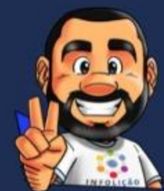
Ilustración de portada: Adinan Batista