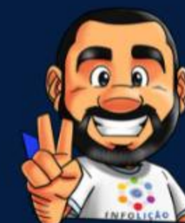
Ilustración de portada: Adinan Batista