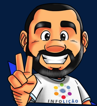
Ilustración de portada: Adinan Batista