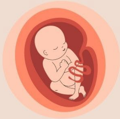
Imagen y semejanza Se nos hizo parecidos a Dios. (Gn 1:27)

Todos somos muy valiosos para Dios, pues pertenecemos a la misma familia y tenemos una herencia en común: