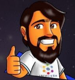
Contenido y diseño: Pablo Amon