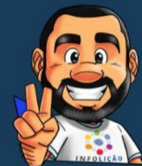
Ilustración de portada: Adinan Batista