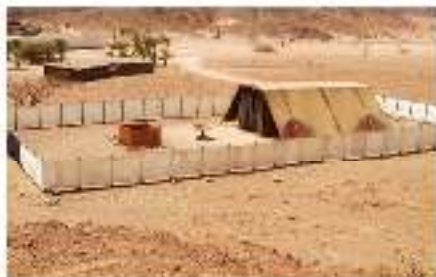
El Tabernáculo en Silo. (1 Su 1:3, 24)