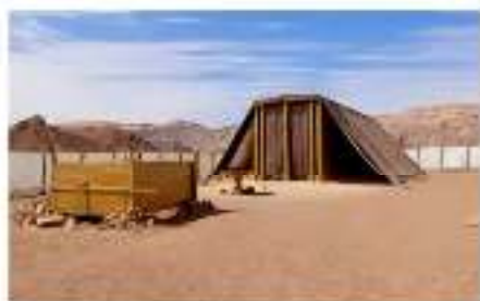
El Santuario en el desierto. (Éx 36:3; Nú 18:21)