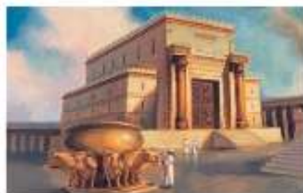
El Templo de Jerusalén (Mt 3:10)