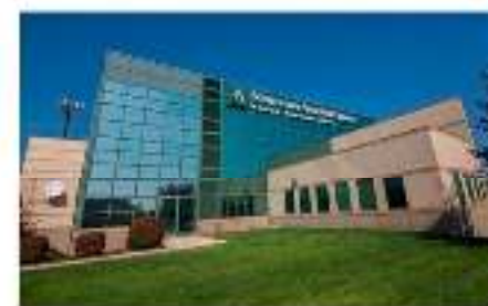
Las dependencias regionales de la iglesia. (Dt 12:5-14)

En armonía con este principio bíblico, la Iglesia Adventista del Séptimo Día ha designado a las asociaciones y misiones; como tesorerías por las cuales se mantiene el ministerio eclesiástico.