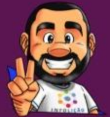
Ilustración de portada: Adinan Batista