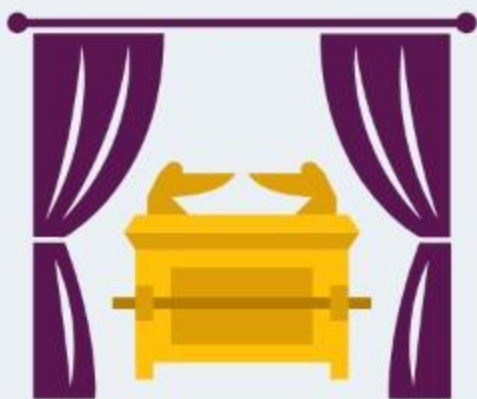
EL VELO (Éx 26:31-35; 28:43)

Dios estableció límites de protección que restringían el acceso al santuario. Esto impedía la intervención de personas no autorizadas.