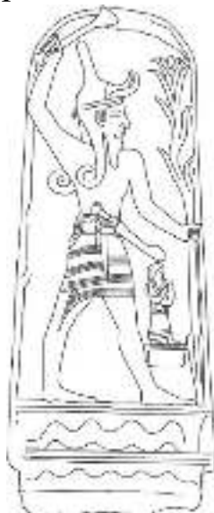
Figura 1. Estela "Baal au foudre" (Louvre, París)

(Salmo 29:3-9) demuestran la superioridad de Dios a medida que incluso los montes "saltan [...] como un buey montés" (versículo 6). "Sirión" en este versículo es el nombre cananeo del Monte Hermón, un claro ataque literario contra la religión cananea, que ve las montañas como la morada inamovible de los dioses y especialmente de Baal.